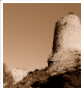
La torre del castillo